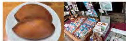
いちじく揚げパン 商品陳列の様子