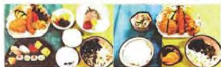
寿司 & 刺身 & フライ ミックスフライランチ

まだまだ現役として十分に続けられる年齢ではありますが、お客様や地域の安心のため、早めに承継準備を始める決意をされました。長くこのお店を、お客様と共に大切に続けていただける方を希望されています。