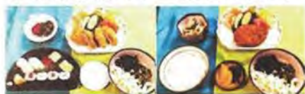
寿司と豚ヒレかつ 牛コロッケランチ