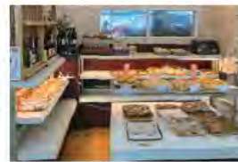
焼きたてパンコーナー