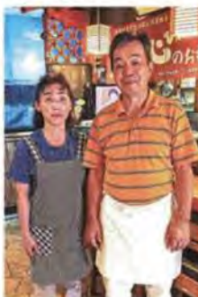
1階テーブル席、個室、カウンター2階宴会場、経営者ご夫妻