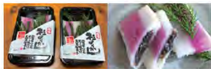
伝統のお菓子「杉ようかん」