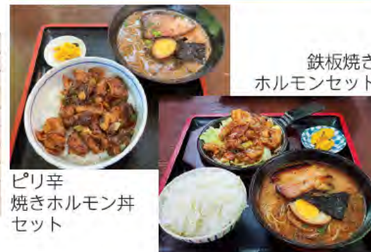
鉄板焼き ホルモンセット