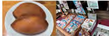
いちじく揚げパン 商品陳列の様子