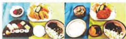
寿司と豚ヒレかつ 牛コロッケランチ