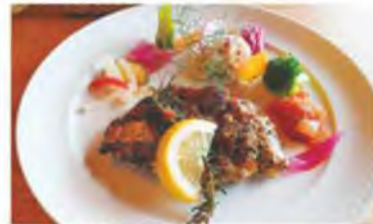
チキンの香草焼き