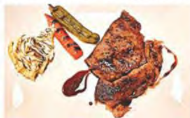
黒毛和牛ステーキ