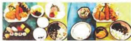
寿司 & 刺身 & フライ ミックスフライランチ

まだまだ現役として十分に続けられる年齢ではありますが、お客様や地域の安心のため、早めに承継準備を始める決意をされました。長くこのお店を、お客様と共に大切に続けていただける方を希望されています。