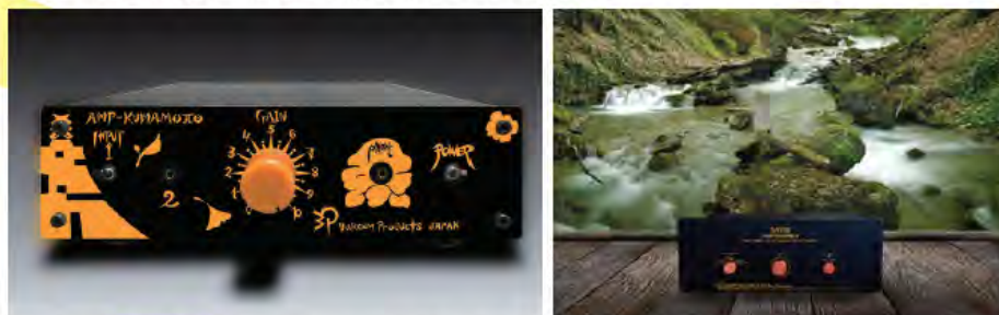
独自理論に基づく全く新しい増幅方式で“ありのままの音”が特徴のSATRI回路アンプ

SATRI回路を搭載した製品は、国内に限らずドイツ等の海外でも表彰され、国内外で高い評価を受けています。