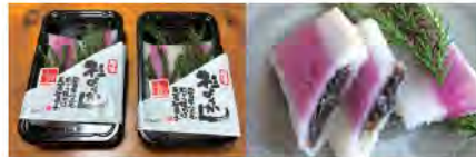
伝統のお菓子「杉ようかん」