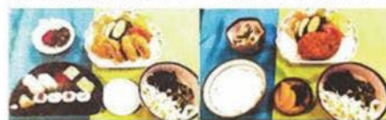
寿司と豚ヒレかつ 牛コロッケランチ