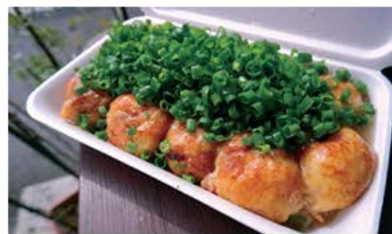
関西風のフワトロたこ焼