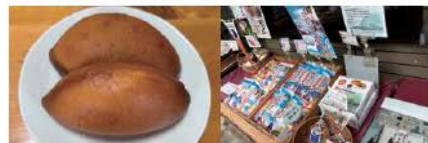
いちじく揚げパン 商品陳列の様子

掲載事業所様への直接のお問い合わせはお控えいただき、本件については天草市商工会で支援しておりますので、まずは商工会にご相談ください。また、後継者探しの掲載を希望される会員事業者様を募集中です。