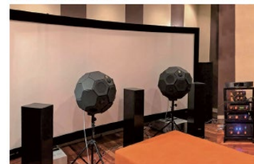
SATRI回路アンプを利用したオーディオシステム

掲載事業者様へ直接のお問い合わせはお控えいただき、本件については合志市商工会で支援しておりますので、まずは所属される商工会にご相談ください。また、後継者探しの掲載を希望される会員事業者様を募集中です。