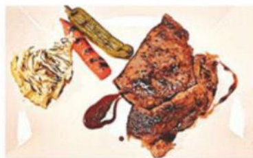
黒毛和牛ステーキ