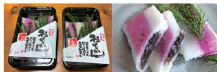
伝統のお菓子「杉ようかん」