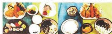
寿司 & 刺身 & フライ ミックスフライランチ

まだまだ現役として十分に続けられる年齢ではありますが、お客様や地域の安心のため、早めに承継準備を始める決意をされました。長くこのお店を、お客様と共に大切に続けていただける方を希望されています。