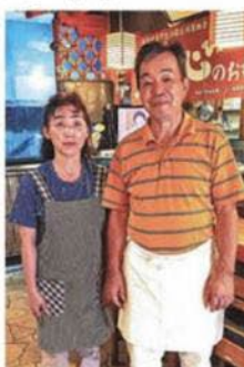
1階テーブル席、個室、カウンター2階宴会場、経営者ご夫妻