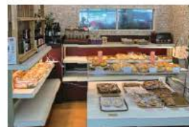
焼きたてパンコーナー