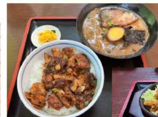
ピリ辛 焼きホルモン丼 セット