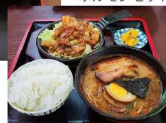
鉄板焼き ホルモンセット

掲載事業者様へ直接のお問い合わせは控えいただき、本件については熊本市託麻商工会で支援しておりますので、まずは商工会にご相談ください。また、後継者探しの掲載を希望される会員事業者様を募集中です。