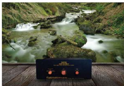
独自理論に基づく全く新しい増幅方式で“ありのままの音”が特徴のSATRI回路アンプ