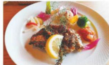
チキンの香草焼き