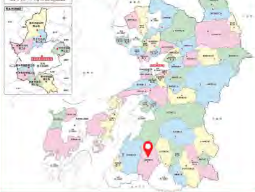
熊本県 49 商工会位図

掲載事業所様への直接のお問い合わせは控えいただき、本件については球磨村商工会で支援しておりますので、まずは商工会にご相談ください。また、後継者探しの掲載を希望される会員事業者様を募集中です。