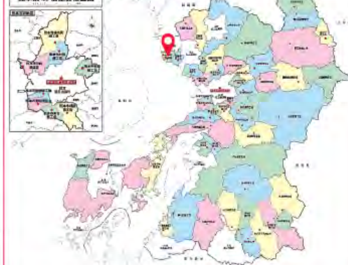
熊本県49商工会位置図