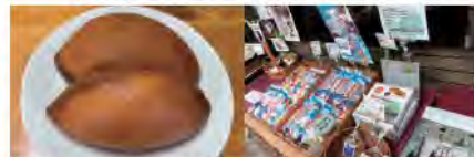
いちじく揚げパン 商品陳列の様子