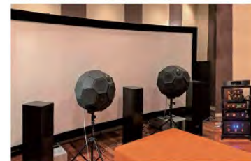
SATRI回路アンプを利用したオーディオシステム

掲載事業者様へ直接のお問い合わせはお控えいただき、本件については合志市商工会で支援しておりますので、まずは所属される商工会にご相談ください。また、後継者探しの掲載を希望される会員事業者様を募集中です。