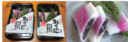
伝統のお菓子「杉ようかん」