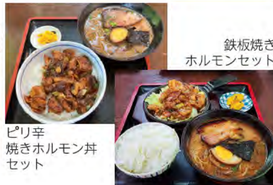
鉄板焼き ホルモンセット