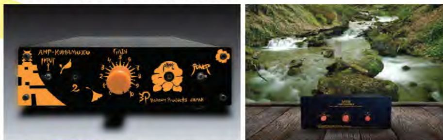
独自理論に基づく全く新しい増幅方式で“ありのままの音”が特徴のSATRI回路アンプ

SATRI回路を搭載した製品は、国内に限らずドイツ等の海外でも表彰され、国内外で高い評価を受けています。