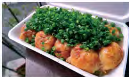
関西風のフワトロたこ焼