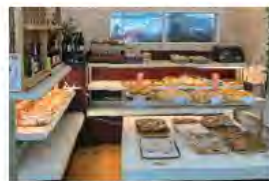
焼きたてパンコーナー