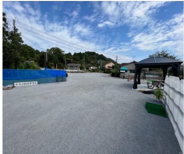
ドッグラン・テラス