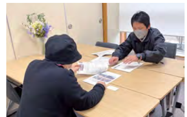
3月5日 能登町商工会 相談室