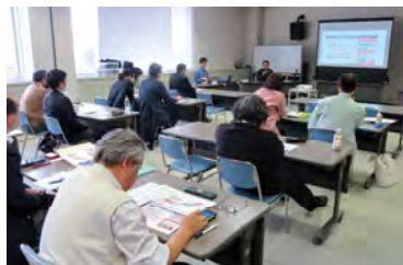
2月16日 中能登町商工会 研修室