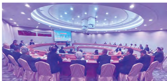
TAITRAとの意見交換会(世界貿易センター)

令和6年1月31日から2月3日の3泊4日の日程で、商工会長等37名が参加した台湾視察研修を行いました。台北市進出口商業同業公会 (IEAT) や 中華民國對外貿易發展協會 (TAITRA) など台湾を代表する経済団体を訪問し、今後の熊本と台湾における様々な産業分野での経済交流等について、有意義な意見交換を行う事が出来ました。