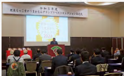
ベストセレクション認定式会長挨拶

令和6年1月18日「肥後もっこすのうまかもんグランプリベストセレクション」認定式を行いました。笠会長から認定証を授与し、受賞事業者から受賞の喜びや開発に至った経緯や想いなどを発表して頂きました。