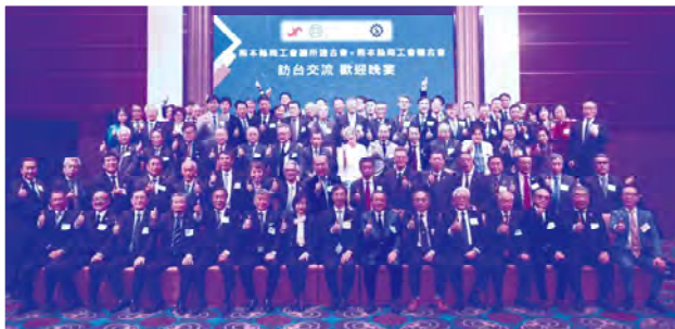
台北市のグランヴィクトリアホテルで開かれたIEATとの交流会

令和6年1月31日から2月3日の3泊4日の日程で、商工会長等37名が参加した台湾視察研修を行いました。台北市進出口商業同業公会 (IEAT) や 中華民國對外貿易發展協會 (TAITRA) など台湾を代表する経済団体を訪問し、今後の熊本と台湾における様々な産業分野での経済交流等について、有意義な意見交換を行う事が出来ました。