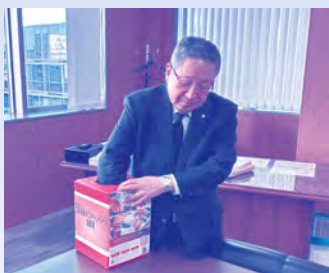
抽選会の様子(笠県連会長)

このキャンペーンは、期間中に被共済者1名あたり4口以上の新規加入もしくは増口された方を対象に、県下8事業所の魅力的な特産品等をプレゼントする企画で、当初の想定を上回る約200名のご応募をいただきました。