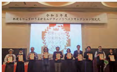
ベストセレクション認定証受賞者