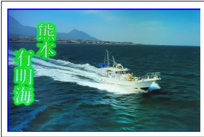
遊漁船の様子

アイデアの尽きない方で、支援をすることが楽しく感じています。今後も伴走支援を続けていきたいです。