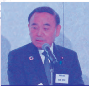
坂本哲志衆議院議員

また、トップセミナー終了後に開催された商工行政懇談会では、熊本県選出の国会議員の方々に加え、参議院の宮本周司議員と越智俊之議員をご来賓としてお招きし、熊本県連の要望事項や全国大会での決議事項を陳情するなど有意義な意見交換を行うことができました。