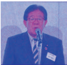
金子恭之衆議院議員