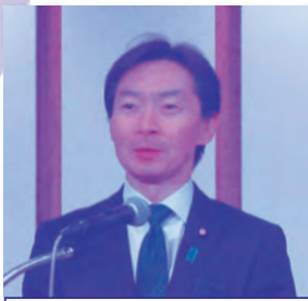
宮本周司参議院議員