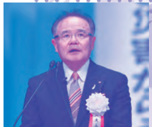
森全国商工会連合会会長