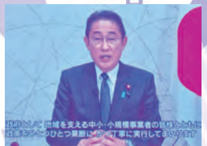
岸田内閣総理大臣