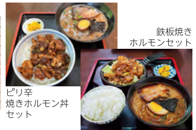
鉄板焼き ホルモンセット