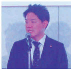
西野太亮衆議院議員