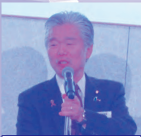
馬場成志参議院議員