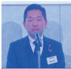
越智俊之参議院議員