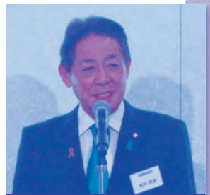
松村祥史参議院議員