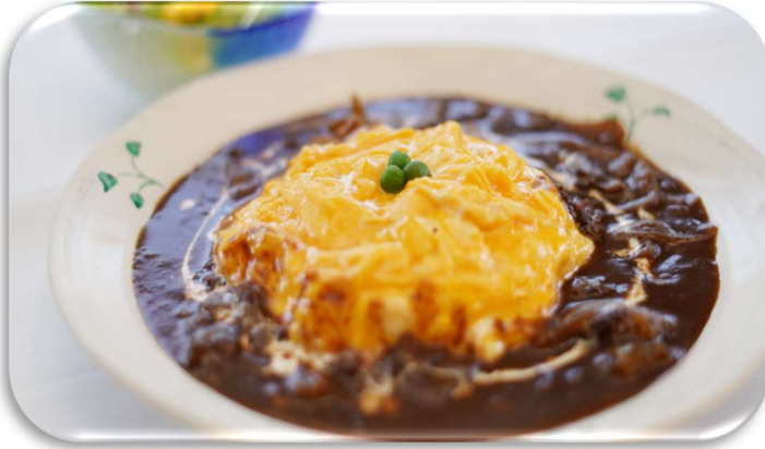
看板メニューのオムハヤシ