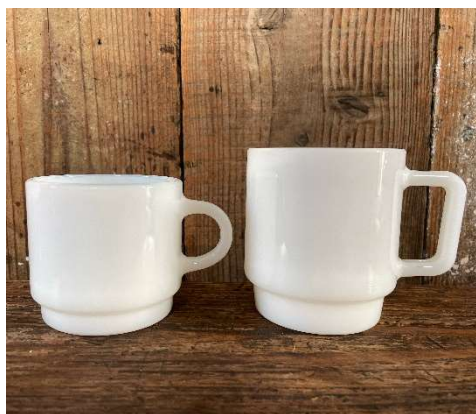
小型マグカップとスタッキングマグ