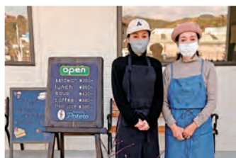
代表者(右)と後継者(左)の制服姿