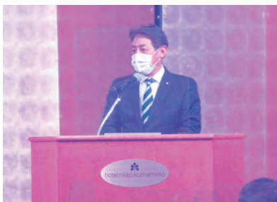
参議院議員 松村氏