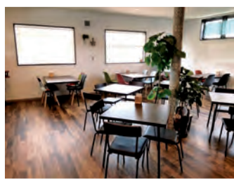
ウィズコロナに対応した 新店舗の内部