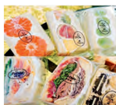
売れ切れ続出の サンドイッチ等の商品