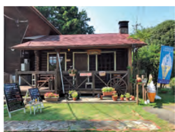
オープンカフェ外観