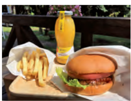
ヘルシー赤牛ハンバーガー