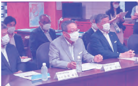
【要望を述べる笠会長(写真中央)】