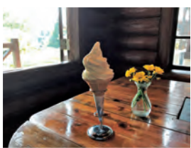
濃厚ソフトクリーム