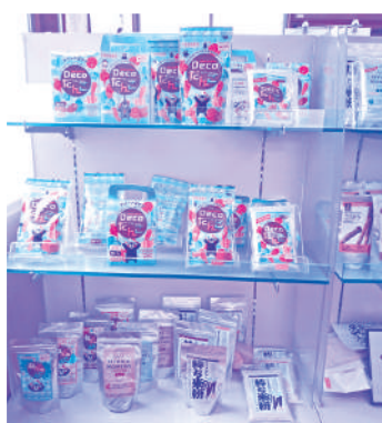
デコレーションだんご