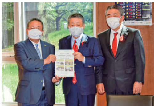
熊本県商工会連合会 笠会長