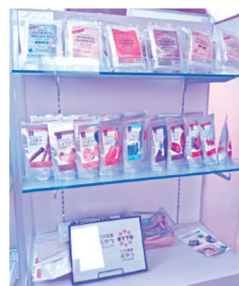
上段:ハイブリッド米粉 中段:野菜パウダー