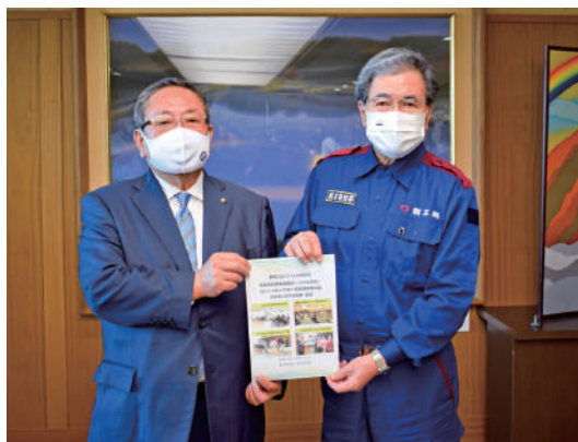
熊本県商工会連合会 笠会長