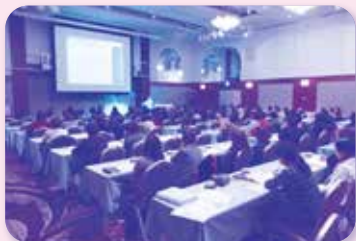
真剣に耳を傾けています