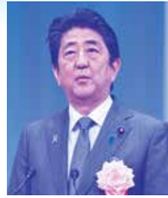
安倍内閣総理大臣

また、引き続き各種表彰が行われ、本県からも中小企業庁長官表彰をはじめとして、下記のとおり受賞されました。