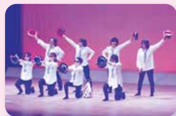
トリを飾った熊本市富合商工会女性部

会場内で熊本市ブロックの特産品展示販売が行われ、買い求める部員で賑わいを見せる一方で商品の補充に忙しい販売担当者の姿がありました。