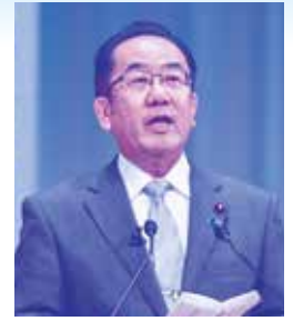
西銘経済産業副大臣