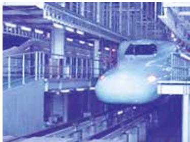
新幹線車両基地車庫

富合町には歴史文化資源も数多くありますが、産業施設資源もあります。その大きな1つとして、平成22年11月に全国3番目となる新幹線熊本総合車両基地が完成しました。敷地面積20万m 2 、全長1.4km、全幅150mの細長の構造であり、8両編成の新幹線車両を収容できる着発収容線13線を有しています。