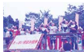
全日本おっばい早飲み選手権

湯前町商工会では、経営発達支援計画にも掲げていますように、珍しい歴史的建造物やそれらを活用したイベント、温泉施設の存在、観光列車の運行(終着駅)、コンパクトな地域柄等、今後における観光増幅の可能性となる地域の強みを活かし、観光(関連)産業分野を中心とした地域産業の活性化に取り組んでまいります。