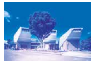
湯前まんが美術館