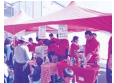
青年部新幹線フェスタ出店