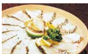
パーティー用BOX(5品予定)