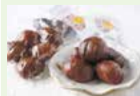
(有)やまえ堂の「やまえ栗渋皮煮」