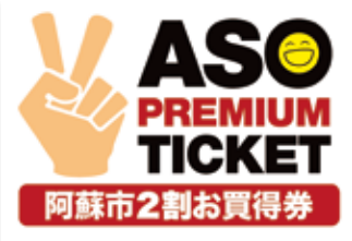
プレミアム商品券

平成27年度の商工会の重点事業としては、経済活性化を図ることを目的に共通して使用できるプレミアム付き商品券の発行、創業・ものづくり・小規模事業者持