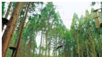
フォレストアドベンチャー

さらに美里町が主体となり今年5月に緑川ダム湖畔にオープンした「フォレストアドベンチャー・美里」は、森の地形や樹木、丸太などを活用してワイヤー・ロープなどでコースを設置した森林体験型アウトドアパークです。樹から樹へロープを伝いながら空中移動をして、自然と親しみつつダイナミックなアウトドアを楽しむことができ、日本初となる垂直落下型アクティビティ「ミノムシシュート」が体験でき