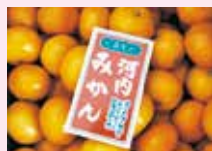
(有)オレンジプロッサム 独自製品「河内みかん」