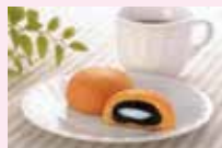
(有)福田屋の「おてもやん」