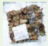
(有)あさぎり町ふるさと振興社(あさぎり物産館)の「赤烏炭焼き鳥」

県内小規模事業者の販売促進支援と、本県経済の振興に資することを目的に、全国商工会連合会のインターネットサイト「ニッポンセレクト」で、第2弾の「菊池・山鹿」と「宇土・宇城・益城」のBOXが販売中です。国の交付金を活用し、定価の3割引で「ふるさと名物」の詰め合わせBOXが購入できます(送料別)。なお送料については、9月から本BOXに限り500円の割引が実施されています。第3弾で「熊本」エリアと「人吉・球磨」エリアのBOXが、10月26日(月)から発売されます。年末や新春用特別企画BOXもあり、第4弾では「八代・芦北・水俣」エリアと「荒尾・玉名」エリア分が、来年1月5日(火)から発売されます。