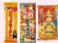
五木食品(株)の「火の国くまもと麺セット」