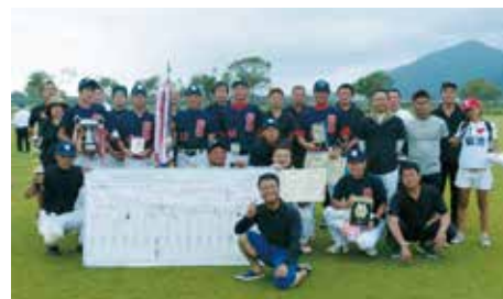
Aパートで優勝した菊池市商工会青年部

👑 優勝 菊池市商工会青年部 準優勝 甲佐町商工会青年部 3位 和水町商工会青年部 3位 水上村商工会青年部