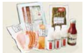
好評だった阿蘇BOX(噴火災害復興支援)