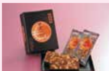
(有)そのやの「肥後もんど」