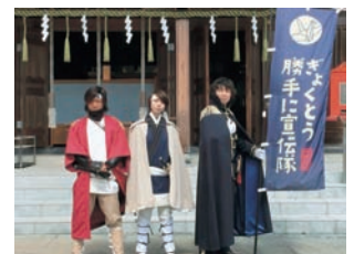
ぎょくとう勝手に宣伝隊

ちづくり事業」では、駅前施設の運営組織母体の立ち上げ、事業計画の作成の他、ぎょくとう勝手に宣伝隊を結成して町を勝手に宣伝しています。