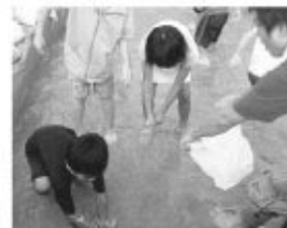
■おぼろのつみみどり