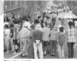
■おいでまつり会場