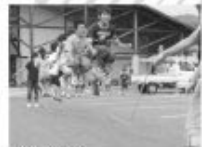
■大井川川保健康センター