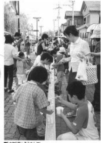
■会場「巨大そのんごし」