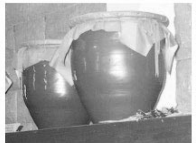
■大山町視察の「福の神」