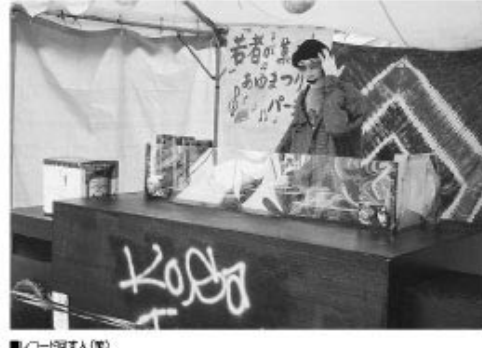
■コーディネーター