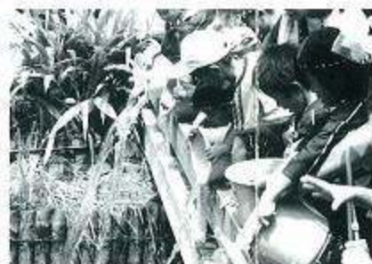
「鮎の放流」早く大きくな~れ