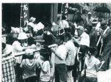
「そうめん流し」そうめんが間に合わないよ~

本年度のあゆまつりは、例年2日間の日程で開催されておりましたが、諸般の事情により1日に短縮され、更に8月に行われていた青年部主催の「おいでまつり」が共催として、同日に開催されました。1日で全ての行事を行ったことで、朝の開会セレモニーから夜の花火まで町は1日中、町内外から大勢の人出で賑わい、祭り一色となりました。