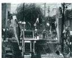
「噴水」誰のアイデアなの?町の活性化になれば