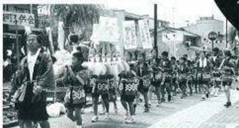
「こどもみこし」こどもより親が大変、疲れ気味