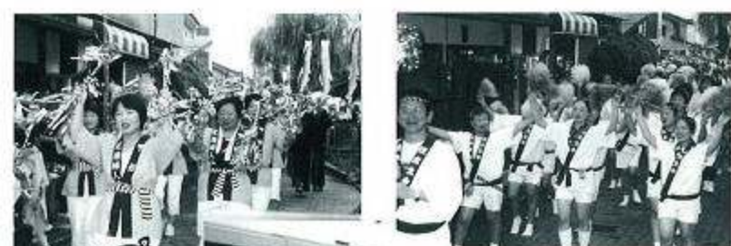
「総盆踊り大会」マツケンサンバのリズムに乗って