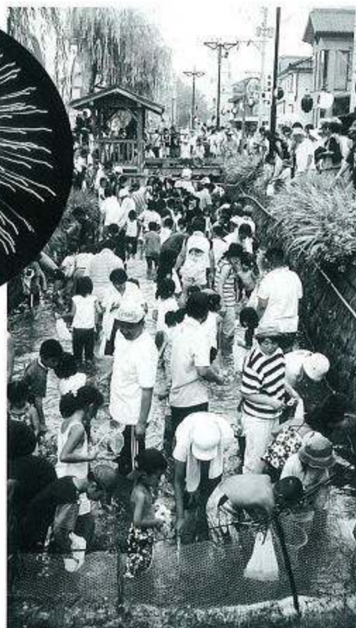
「あゆのつかみどり大会」あゆより人が多いのでは?