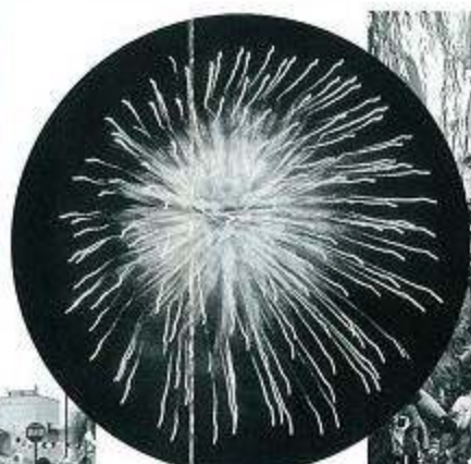
「花火大会」さすが甲佐の「花火大会」は素晴らしい