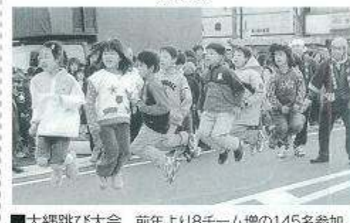
■大縄跳び大会 前年より8チーム増の145名参加。応援者300名の大熱戦。

甲佐町の初市は今年から三三六年前、寛文八年に月三回(九日、十九日、二十九日)の三斎市(定期市)として始まりました。 今年も例年通り三月九日(火)、十日(水)の両日、春の到来を告げる暖かい日差しの中で約八十店の露店と多彩なイベントを織り込んで、市街地を中心に賑やかに開催されました。