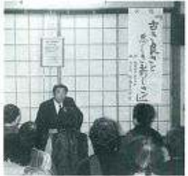
「古き良きと悪き新しき」女性部新年茶話会

第四回大会が去る十一月五日メルパルク熊本大ホールで開催されました。県下九ブロックの代表による発表が行われ、行政を頼らず自分達の力で取り組んだ夏、冬の登山でのイベント「登山火祭り」冬あかり地域に住んでいる私達が地域を支えていかなければという強い思い。阿蘇ブロック代表西原村商工会の女性部に最優秀賞が贈られました。地域がある限り、女性部がある限りそこに大きな夢がある感動の連続でした。