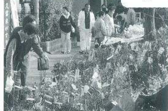
定番の植木市は愛好家で人出が絶えない。