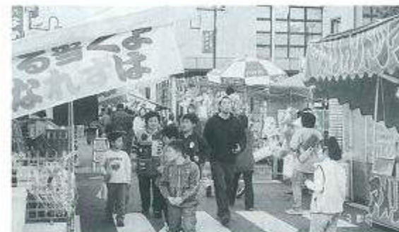
■にぎやかな露店商 両日も晴天に恵まれたが、今年も減少傾向に歯止めが掛からず前年の二割減の人出であった。

甲佐町の初市は今年から三三六年前、寛文八年に月三回(九日、十九日、二十九日)の三斎市(定期市)として始まりました。 今年も例年通り三月九日(火)、十日(水)の両日、春の到来を告げる暖かい日差しの中で約八十店の露店と多彩なイベントを織り込んで、市街地を中心に賑やかに開催されました。