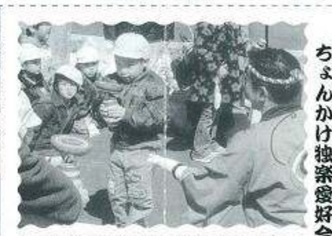
肥後 ちよんかけ独楽愛好会

◆ひな祭り飾り 記帳四〇五名 見物者約一、二〇〇名で大好評、常に飛躍を目指す女性部は、強い。