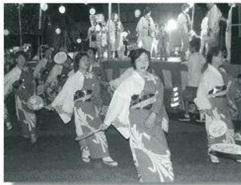
盆おどり大会 参加20チーム (900名) 2年連続緑町チームの優勝

今年も甲佐町恒例の「あゆまつり」が7月24日、25日の両日にわたり、暑さと長引く不景気を吹き飛ばし、元気な甲佐町を取り戻そうと賑やかに開催されました。