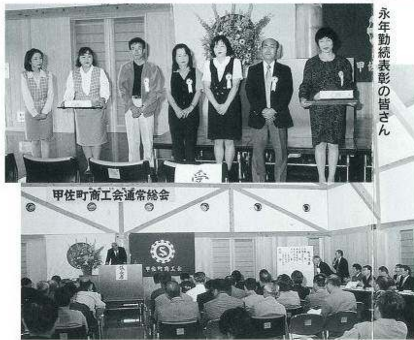
永年勤続表彰の皆さん

発行所 甲佐町商工会 責任者 田中武敏 印刷 (有)スタアテック 熊本市白山1丁目5-12 TEL.096-372-6336 会員数 320名