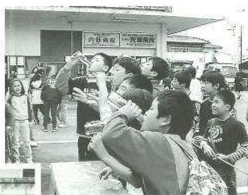
(はよ飲まにや食べるばい)

甲佐の初市は今から334年前、寛文8年に月3回(9日、19日、29日)の三斎市(定期市)として始まりました。 「まるで初市のような」という言葉は、甲佐に住む住民にとって「賑やか、活気、心うきうき、雑多、喧噪、好奇心、冒険心、春の到来」を意味するものであります。今年3月9日(土)、10日(日)の両日、晴天に恵まれ約80店舗の出店、多彩なイベントを織り込んで、商工会主催で賑やかに開催されました。