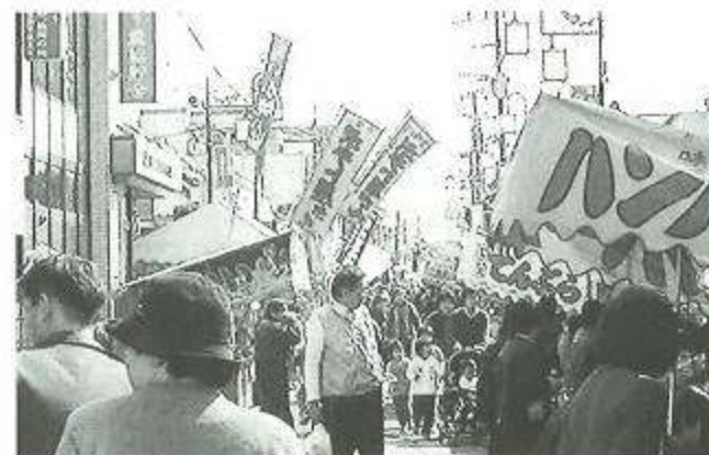
露天全体 約80店の出店 晴天に恵まれ昨年より2割増 12,000人(両日)の人出で賑わった

甲佐の初市は今から334年前、寛文8年に月3回(9日、19日、29日)の三斎市(定期市)として始まりました。 「まるで初市のような」という言葉は、甲佐に住む住民にとって「賑やか、活気、心うきうき、雑多、喧噪、好奇心、冒険心、春の到来」を意味するものであります。今年3月9日(土)、10日(日)の両日、晴天に恵まれ約80店舗の出店、多彩なイベントを織り込んで、商工会主催で賑やかに開催されました。