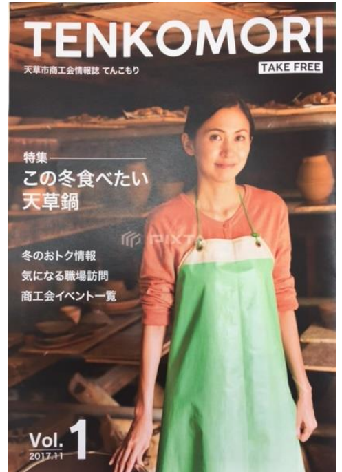
新会報イメージ(上) 掲載料金(下)